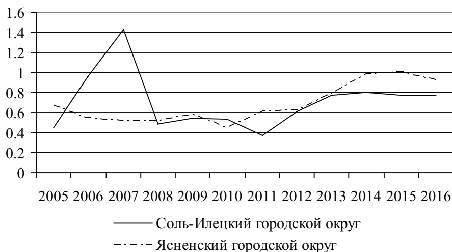
Рисунок 3. Коэффициенты миграционной привлекательности монопрофильных муниципальных образований, отнесённых к Категории 3

Анализ графиков рисунка 3 позволяет сделать вывод, что в настоящее время наиболее привлекательными для мигрантов являются моногорода 3-ей категории, включающей Соль-Илецкий и Ясенский городские округа, которые начиная с 2011 г. демонстрируют рост динамики коэффициента миграционной привлекательности.