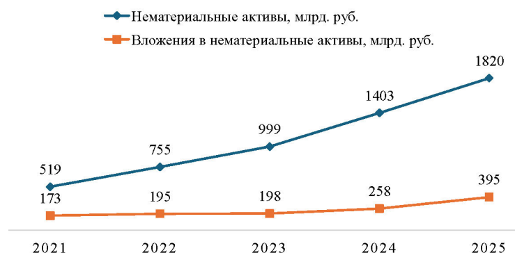
Рисунок 3. Статистика нематериальных активов

Технологические аспекты трансформации банковской деятельности в рамках технологического детерминизма можно проследить через динамику нематериальных активов и вложения в них, отраженных в балансе банковской системы. Данные для анализа представлены на рисунке 3.