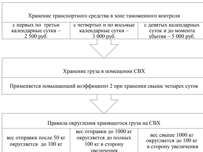
Рисунок 2. Варианты дифференциации цен на услуги хранения

«Принудительный» характер в совокупности со свободным ценообразованием может оказать благотворное влияние для манипулирования ценами вне зависимости от объема оказываемых услуг (особенно когда в зоне деятельности таможенного органа функционирует один СВХ), прибегая к различным вариантам манипуляций с перечнем оказываемых услуг и ценами на них [8], которые представлены на рисунке 2.