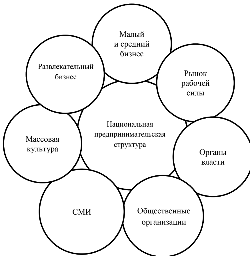
Рисунок 3. Фрактальный подход к взаимодействию национальных предпринимательских структур с фракталами I уровня