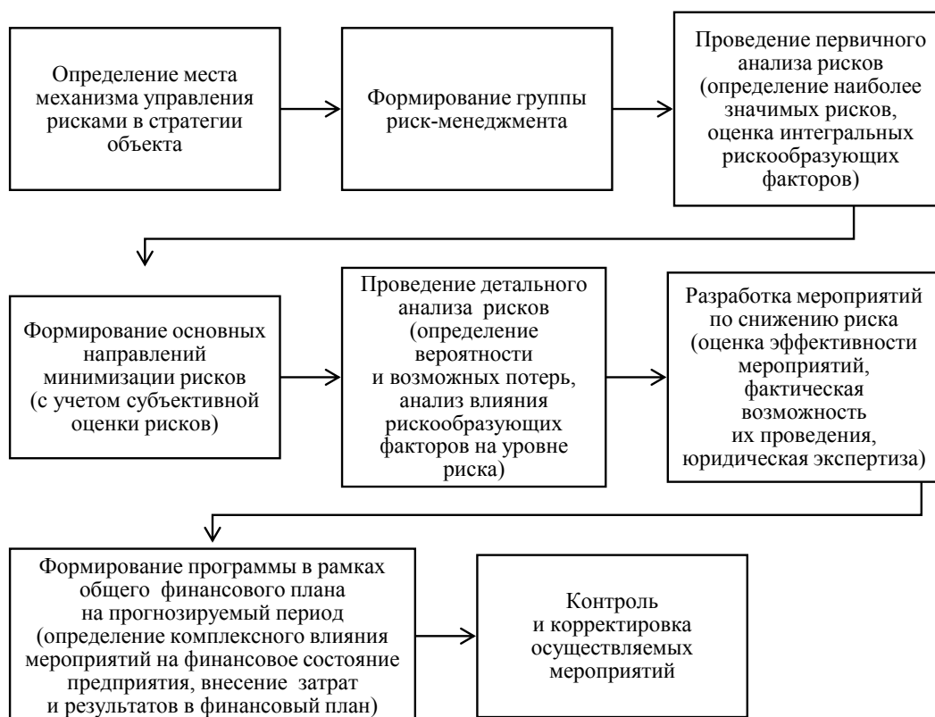
Рисунок 2. Алгоритм функционирования системы риск-менеджмента