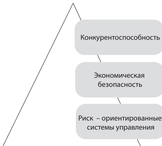
Рисунок 1. Пирамида обеспечения конкурентоспособности национальной экономики